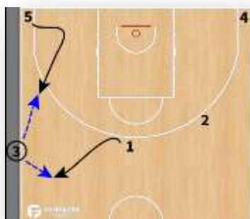
La touche côté / La touche fond

Les touches auront pour objectif principal de rentrer la balle, sans écrans. Les placements (notion de spacing) sont tout de même importants, en donnant des priorités sur qui se démarque.